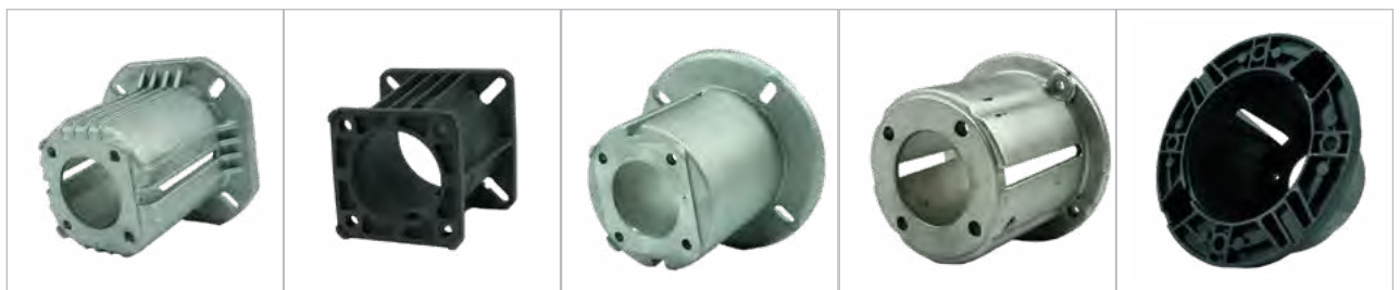
ZF044 / 502200