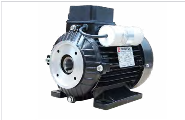
E-motor - 450200 / 450205 / 450207