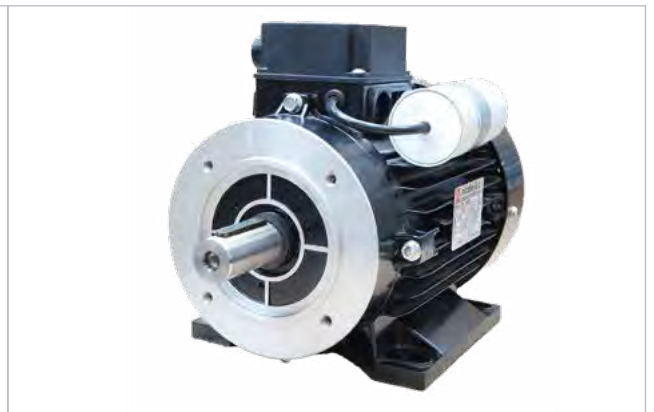
E-motor - 450235