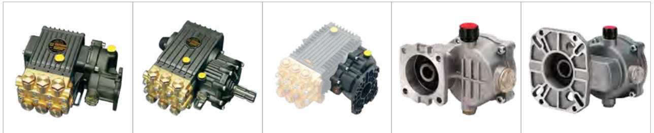
RS99 / 502020