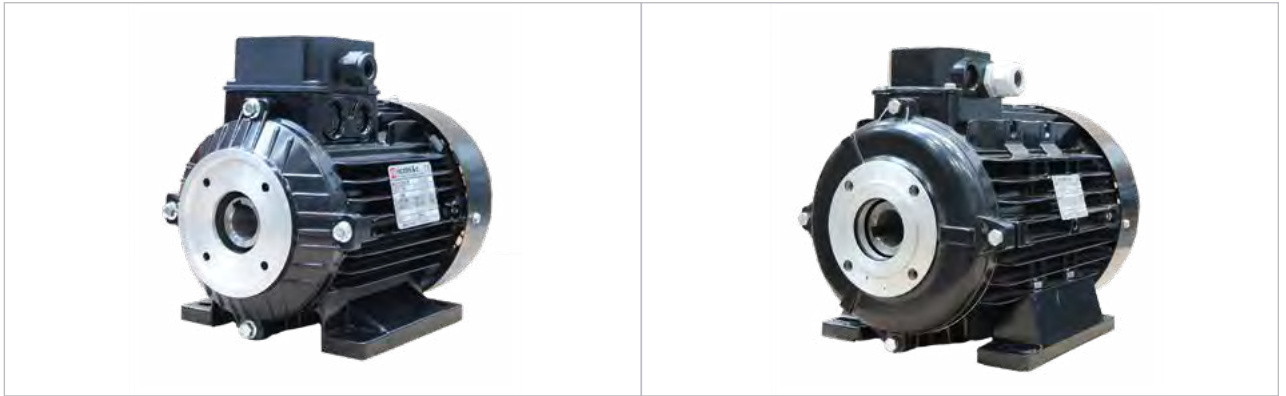
E-motor - Hollewelle / 450002